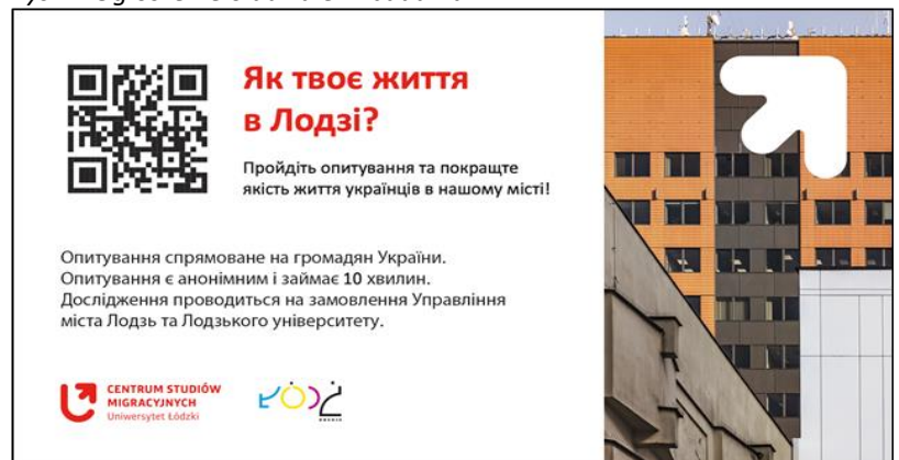
Rys. 1. Ogłoszenie o udziale w badaniu

Do zbierania danych wykorzystano ankietę internetową, którą dystrybuowano w sieciach społecznościowych i poprzez ogłoszenia z kodami QR (zob. rys. 1.) rozwieszane w placówkach podległych