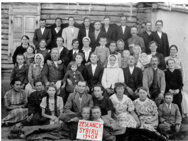
Fot. 2. Grupa polskich zesańców w obwodzie kustanajskim (Kazachska SRR) w 1940 r. (zbiory Ośrodka KARTA).

Tymczasem w głębi ZSRR, czyli na wschód od granicy polsko-radzieckiej wytyczonej traktatem ryskim, przebywała pokaźna masa ludności polskiej – głównie zesańców lat wojny (w latach 1940-1941 Sowieci deportowali ponad 320 tys. mieszkańców anektowanych obszarów Polski). Rodaków na Syberii, w Kazachstanie i w innych częściach ZSRR dotyczyło „Porozumienie o prawie zmiany obywatelstwa i ewakuacji”, podpisane 6 lipca 1945 r. w Moskwie. Obejmowało ono tylko Polaków i Żydów – obywateli II RP do 17 września 1939 r. Zesańcom innych narodowości (albo za takich arbitralnie uznanych) zamknięto drogę do powrotu do ojczyzny. Należy podkreślić, że była to pierwsza umowa, w której wyraźnie zaakcentowano sprawy obywatelstwa (dotyczył go już jej tytuł). Przyszli repatrianci musieli przejść trudną i upokarzającą procedurę jego zmiany przed komisjami złożonymi z radzieckich urzędników i milicjantów, którzy faktycznie decydowali o tym, komu można było nadać obywatelstwo Polski .