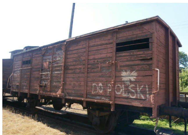
Fot. 1. Wagon repatriacyjny z lat czterdziestych XX w. (fot. Autor).

Drugi rozdział ruchów migracyjnych Polaków z ZSRR zapoczątkowały zmiany terytorialne Polski po II wojnie światowej. Nie czekając na oficjalne ustalenia aliantów dotyczące przebiegu granicy polsko-radzieckiej, Stalin w 1944 r. uznawał tę sprawę za przesądzoną. Plan radzieckiego dyktatora usankcjonowała umowa graniczna pomiędzy ZSRR a Polskim Komitetem Wyzwolenia Narodowego z 27 lipca 1944 r. W ślad za stalinowskim postulatem depolonizacji wschodnich województw II RP, kierowany przez Edwarda Osóbkę-Morawskiego PKWN wkrótce zawarł z trzema ościennymi republikami radzieckimi układy o „ewakuacji ludności”: 9 września 1944 r. z Białorusią i Ukrainą oraz 22 września 1944 r. z Litwą. Należy zakładać, że w zasadzie jednakowy tekst tych trzech porozumień został podyktowany przez stronę radziecką.