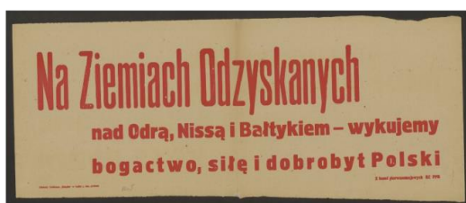
Fot. 5. Afisz propagandowy KC PPR z 1946 r. (zbiory Biblioteki Narodowej – domena publiczna).

Utratę części terytorium Polski na rzecz Związku Radzieckiego miały zrekompensować obszary Niemiec. W języku urzędowym i propagandzie Polski Ludowej nazywane one były Ziemiemi Odzyskanymi . Dziś, po trzech dekadach od przemian ustrojowych wielu historyków wciąż używa tego określenia, ujmując je jednak w cudzysłów. Moim zdaniem należy je zastąpić bardziej adekwatnym terminem, oddającym kontekst historyczny, a przy tym pozbawionym naleciałości propagandowych, np. Ziemie Przyłączone – to znaczy te, które przyłączono do Polski po II wojnie światowej.