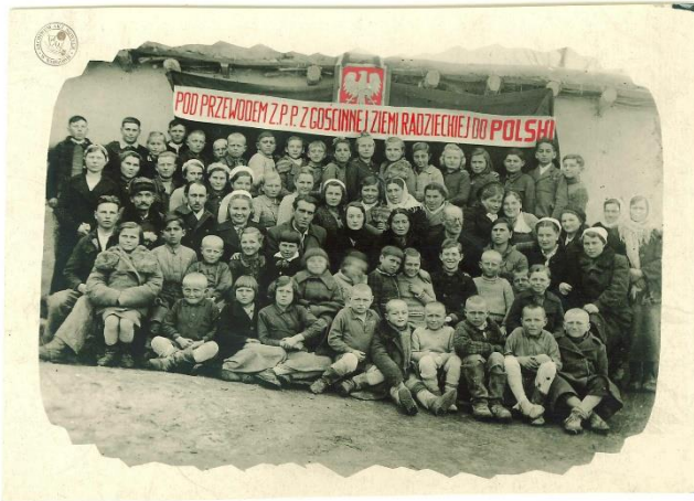
Fot. 4. Wychowankowie i personel polskiego sierocińca w Burnoje w Kazachstanie tuż przed repatriacją, 1946 r..

Utratę części terytorium Polski na rzecz Związku Radzieckiego miały zrekompensować obszary Niemiec. W języku urzędowym i propagandzie Polski Ludowej nazywane one były Ziemiemi Odzyskanymi . Dziś, po trzech dekadach od przemian ustrojowych wielu historyków wciąż używa tego określenia, ujmując je jednak w cudzysłów. Moim zdaniem należy je zastąpić bardziej adekwatnym terminem, oddającym kontekst historyczny, a przy tym pozbawionym naleciałości propagandowych, np. Ziemie Przyłączone – to znaczy te, które przyłączono do Polski po II wojnie światowej.