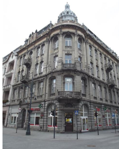
Fot. 3. Siedziba ZC PUR w Łodzi – widok współczesny