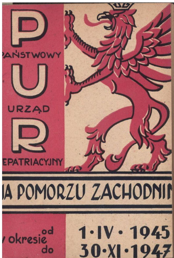
Fot. 6. Okładka opracowania pt. Państwowy Urząd Repatriacyjny na Pomorzu Zachodnim w okresie od 1.IV.1945 do 30.XI.1947

oddziałów wojewódzkich: „Transporty z głębi ZSRR należy otoczyć specjalną opieką i traktować zagadnienie ich urzędzenia i osiedlenia w terenie jako kwestię doniosłą i pilną” 28 . W 1946 r. trwały także przesiedlenia Polaków ze wschodnich województw II Rzeczypospolitej, choć liczba przyjezdnych nie była już tak duża, jak rok wcześniej.