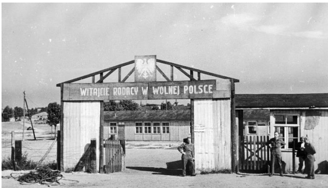
Fot. 1. Obóz repatriacyjny dla żołnierzy Polskich Sił Zbrojnych na Zachodzie, 1947 r.

W tworzonej metodą faktów dokonanych nowej rzeczywistości geopolitycznej, podporządkowane Kremlowi władze Polski „lubelskiej” 6 w pierwszej kolejności rozwiązały kwestię transferów ludnościowych ze Związkiem Radzieckim. Kolejno 9 i 22 września 1944 r. zostały podpisane układy z radziecką Białorusią, Ukrainą i Litwą o obustronnej „ewakuacji” ludności. Dały one podstawę do masowych przesiedleń obywateli polskich z obszarów „odstąpionych Związkowi Radzieckiemu” 7 . Niemal rok później (6 lipca 1945 r.) Polska podpisała czwartą umowę repatriacyjną, tym razem jednak na wyższym szczeblu – nie z pojedynczymi republikami związkowymi, ale z samym ZSRR. To porozumienie dotyczyło z kolei przede wszystkim obywateli polskich, którzy znajdowali się w głębi tego państwa (jako byli zesańcy, więźniowie lub łagiernicy) 8 .