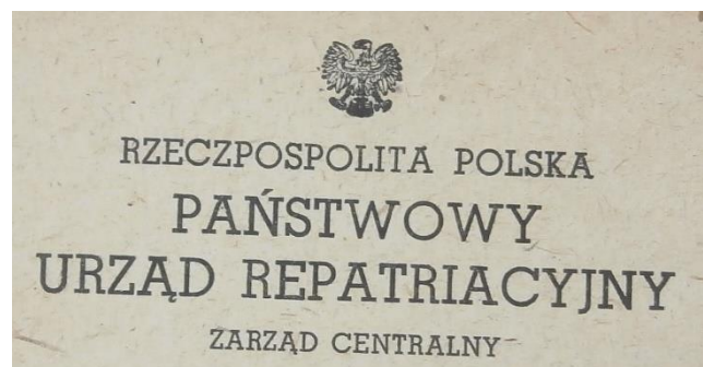
Fot. 5. Fragment druku urzędowego ZC PUR w Łodzi

ogromne nasilenie pracy! Wobec wzmagającej się repatriacji ze Wschodu dochodzi nowa akcja, mianowicie wewnętrzznego przesiedlenia się ludności z terenów ubogich i zniszczonych na ziemie zachodnie nowowyzwolone. Przeprowadzenie tej akcji rząd powierzył PURowi. Musimy działać szybko, sprawnie i planowo” 20 .