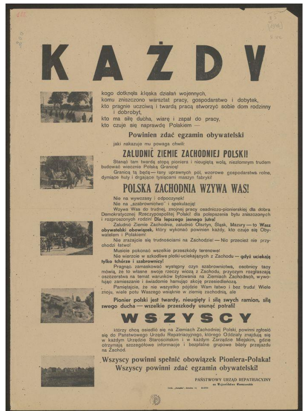
Fot. 2. Plakat Państwowego Urzędu Repatriacyjnego, 1946 r.