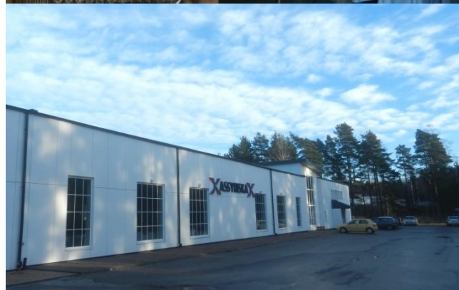
Fot. 3. Sala w Federacji Asyryjskiej udekorowana na okoliczność wesela

Obecnie Asyryjczycy/Aramejczycy dysponują w Szwecji kilkudziesięcioma własnymi kościołami i wieloma dublującymi się instytucjami, przy czym aramejskie są nieco młodsze od asyryjskich. Asyryjska Federacja w Szwecji (ufundowana w 1977 r.) jest organizacją patronacką dla 33 różnych asyryjskich organizacji. Założona rok później Syriacka Federacja w Szwecji zrzesza 30 syriackich/aramejskich organizacji. Sławę zdobyły drużyny piłkarskie dzielące stadion w Södertälje – Assyriska FF (1974; w 2004 r. grała w szwedzkiej ekstraklasie) oraz Syrianska FC (1977), które wzmacniają uczucia narodowe odpowiednio frakcji asyryjskiej i aramejskiej. Podobną rolę odgrywają stacje telewizyjne (Assyria TV, Suroyo TV, Suryoyo SAT) oraz czasopisma – asyryjskie „Hujâdâ” (zob. rys. 4) i aramejskie „Bahro Suryoyo”.