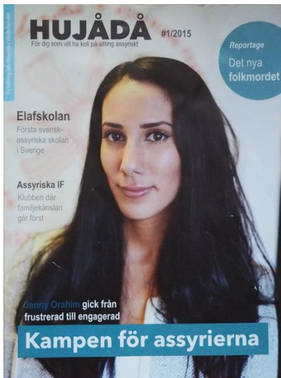
Fot. 4. Asyryjskie czasopismo „Hujådå” (Jedność) ukazuje się od 1978 r.

Asyryjczycy/Aramejczycy są aktywni politycznie – korzystają zarówno z czynnego, jak i biernego prawa wyborczego. Można wśród nich spotkać wyborców wszystkich partii. Czterech przedstawicieli wspólnoty zasiada obecnie w szwedzkim parlamencie, Riksdagu (AINA 2018). Najbardziej znanym szwedzkim politykiem tego pochodzenia jest socjaldemokrata Ibrahim Baylan, który dodatkowo pełni funkcję ministra przedsiębiorczości i innowacji.