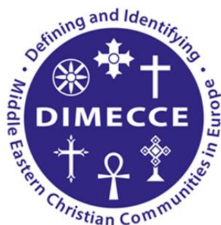
Rys. 1. Logotyp projektu DIMECCE. Więcej o projekcie: https://arts.st-andrews.ac.uk/dimecce/

Diasporę asyryjsko-aramejską badałam w latach 2013-2015 w ramach projektu „Wspólnoty bliskowschodnich chrześcijan w Europie: próba definicji oraz identyfikacji” ( Defining and Identifying Middle Eastern Christian Communities in Europe , w skrócie DIMECCE), który uzyskał dofinansowanie konsorcjum Humanities in the European Research Area (HERA) w 7 Programie Ramowym UE. Projekt realizowany był przez trzy uczelnie – University of St. Andrews w Wielkiej Brytanii, Roskilde University w Danii oraz Uniwersytet Łódzki.