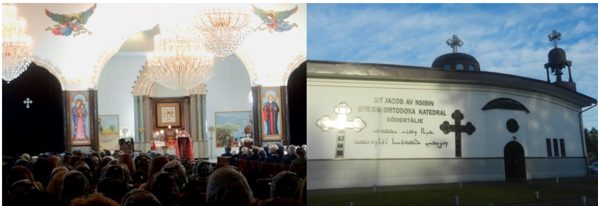
Fot. 2. Msza w syryjsko-ortodoksyjnej katedrze p.w. św. Jakuba w Södertälje

Starający się o azyl Asyryjczycy/Aramejczycy nie precyzowali zwykle powodów swojej emigracji z Bliskiego Wschodu, poza ogólnym stwierdzeniem, że uciekają przed prześladowaniami (Atto 2011). Bezpośrednie prześladowania dotknęły tylko niektórych (zwłaszcza w Iraku), jednak praktycznie wszyscy narażeni byli na życie w niepewności, która miała dwa wymiary – materialny (oznaczający brak dostępu do edukacji, służby zdrowia, intratnych zawodów) i niematerialny (rozumiany jako niemożność swobodnego wyrażania swojej tożsamości kulturowej i językowej). Znakomita większość migrantów pochodziła z Turcji (regionu Tur Abdinu) i należała do Syryjskiego Kościoła Ortodoksyjnego. Pozostali byli członkami Chaldejskiego Kościoła Katolickiego, Asyryjskiego Kościoła Wschodu, Syryjskiego Kościoła Katolickiego lub Kościołów protestanckich. Kluczowe, zwłaszcza w pierwszych latach po przybyciu do nowego kraju,