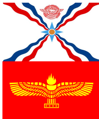
Rys. 2. Flaga asyryjska przyjęta w 1971 r. (po lewej) i flaga aramejska (z 1980 r.). Pobrane z: https://en.wikipedia.org/wiki/Assyrian_flag i https://en.wikipedia.org/wiki/Aramean-Syriac_flag

Jednak asyryjski/aramejski głos najbardziej osłabia wewnętrzny spór, który w Szwecji określany jest jako namnkonflikten (konflikt wokół nazwy grupy), choć nie o same nazwy chodzi, lecz o kryjące się za nimi ideologie i wizje tożsamości zbiorowych. Co warte zauważenia, bywa, iż Asyryjczycy i Aramejczycy to członkowie tych samych rodzin – nawet wśród bliskich głównych działaczy obu frakcji zdarzają się osoby wybierające konkurencyjną identyfikację. W warstwie wizualnej odróżniają ich symbole: flaga z gwiazdą, skrzydlate byki, brama Isztar, bóg Aszur itp. po stronie asyryjskiej, po aramejskiej zaś czerwono-żółta flaga ze znakiem uskrzydłonej pochodni.